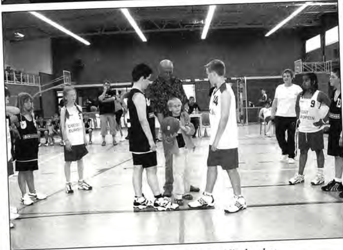
Fotoen: Jugendturnéier an Nitebasket