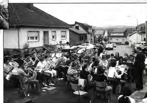
2 Fotoen: Concert op der Plëss'05

Dënssdes, de 28 Juni : ëm 20.30 Auer CONCERT op der Plëss